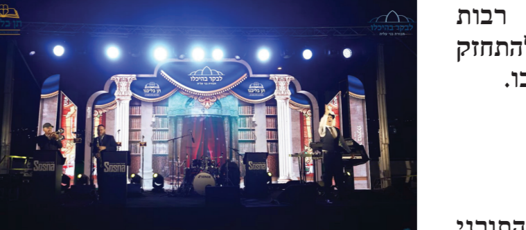
שישו ומסוח בשמחת התורה