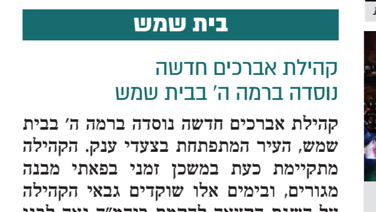
מעמד המסכים בבניין האומה בהשתתפות אלפי בני הישיבות הקה