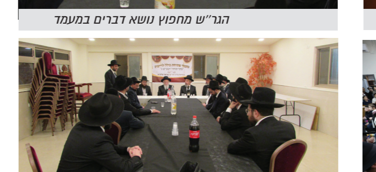
מעמד סיום הכולל