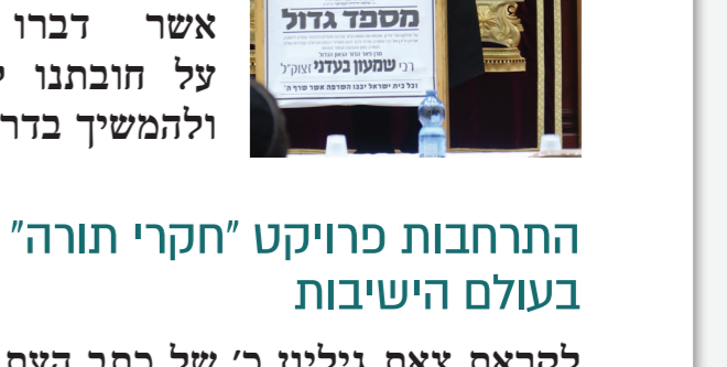
פעילות חינוכית בבני התמים לארפי בני הישיבות