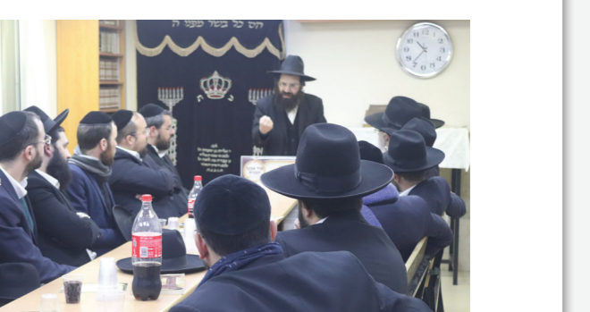
מעמד סיום הכולל