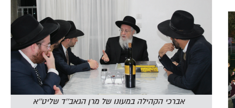
אברכי ההקלה במעמד של מרן האב"ד שליט"א

ביי בקה מעמד פתיחת כולל לדיניות כתר תורה ורמ"ש ג' לואר הביקוש הרב - מולל חדש לדיניות הוקם בברכת בית שמש ג' בראשות הגאון אשדני מורנו הגאון רבי אברהם זכותא שליט"א רב צפון העיר בני ברק, וזכתה להכניס ס"ת מהודר. לרגל חגיגת האירוע - ציר זבונטנסקי כולו נחנש לשעה קלה על ידי המסמרה.