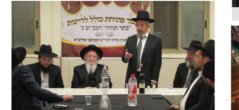
הג"ר חתמ"ץ נחשד ברבים במעמד