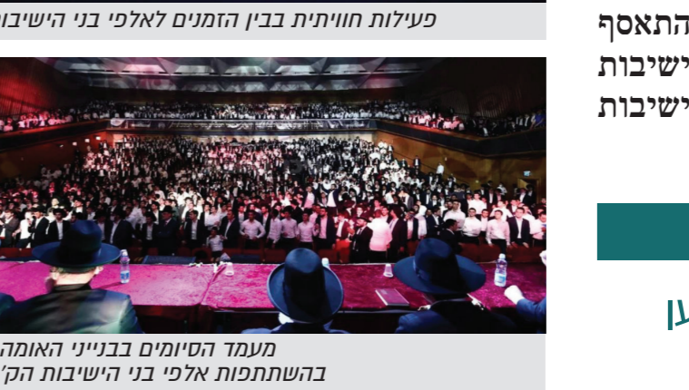
מעמד המסכים בבניין האומה בהשתתפות אלפי בני הישיבות הקה