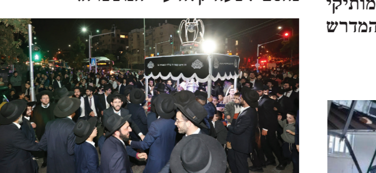
עיסור המשתתפים בתהלוכה