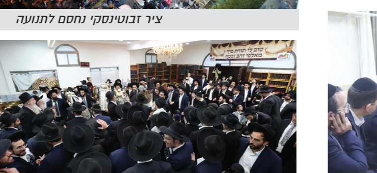
מעמד סיום הכולל